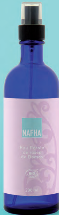
Frasco de spray azul de 200 ml