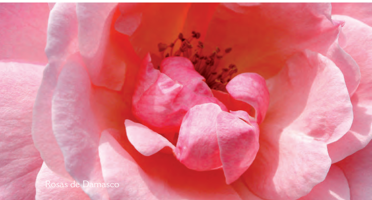
Rosas de Damasco

Especialmente para os homens... As propriedades anti-sépticas da água de rosas actuam como um after shave tonificante sem álcool.