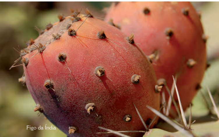
Figo da Índia

Verdadeiro tratamento de choque, aplique o Óleo de sementes de figos da Índia NAFHA directamente em cada estria.